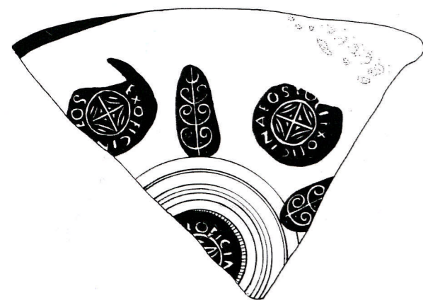
Ilot Nazareth. Assiette dérivée de sigillée paléochrétienne noire à décor estampé : rouelles et palmettes alternées, médaillon central incomplet. Motif circulaire entouré du nom de l'atelier. Production de la zone atlantique (éch. 1/2). V e - VI e siècle.

La totalité de la surface comprise entre la rupture de pente et le rempart est désormais libre de construction. Ceci permet d'envisager que cet espace, relevant sans doute de la puissance publique et devenu vacant, a été très tôt annexé à Saint-Pierre-le-Puellier. Si ce changement de fonction des lieux paraît probant pour le haut Moyen Age, il faudra attendre le XIII e siècle pour voir la mise en place du parcellaire médiéval.