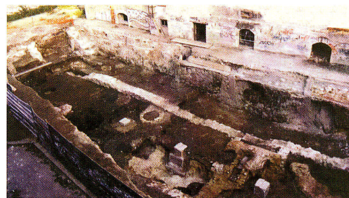
Ilot Nazareth. Partie sud-ouest de la fouille, vue générale du sud. Niveaux d'occupation extérieure du haut Moyen Age traversés d'est en ouest par un mur construit au Bas Moyen Age.