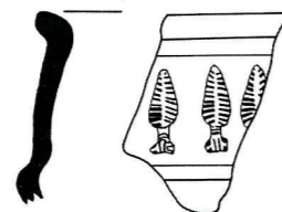
Ilot Nazareth. Bol en terre cuite noire à décor estampé : palmettes ou poissons stylisés (éch. 1/2). VI e siècle.