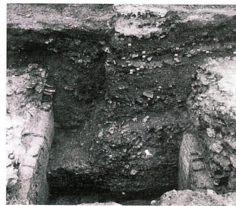
Ilot Nazareth. Partie sud-ouest de la fouille, détail, vue du nord. En coupe : comblement de l'entrepôt sud-ouest, daté de la fin du IV e ou du début du V e siècle, recouvert par les niveaux d'occupation extérieure médiévaux.

La fouille n'a mis au jour aucune structure médiévale à l'exception de deux puits datables du XIII e ou du XIV e siècle et de la fondation de deux murs dont un traverse le site d'est en ouest et dont la fonction reste encore imprécise.