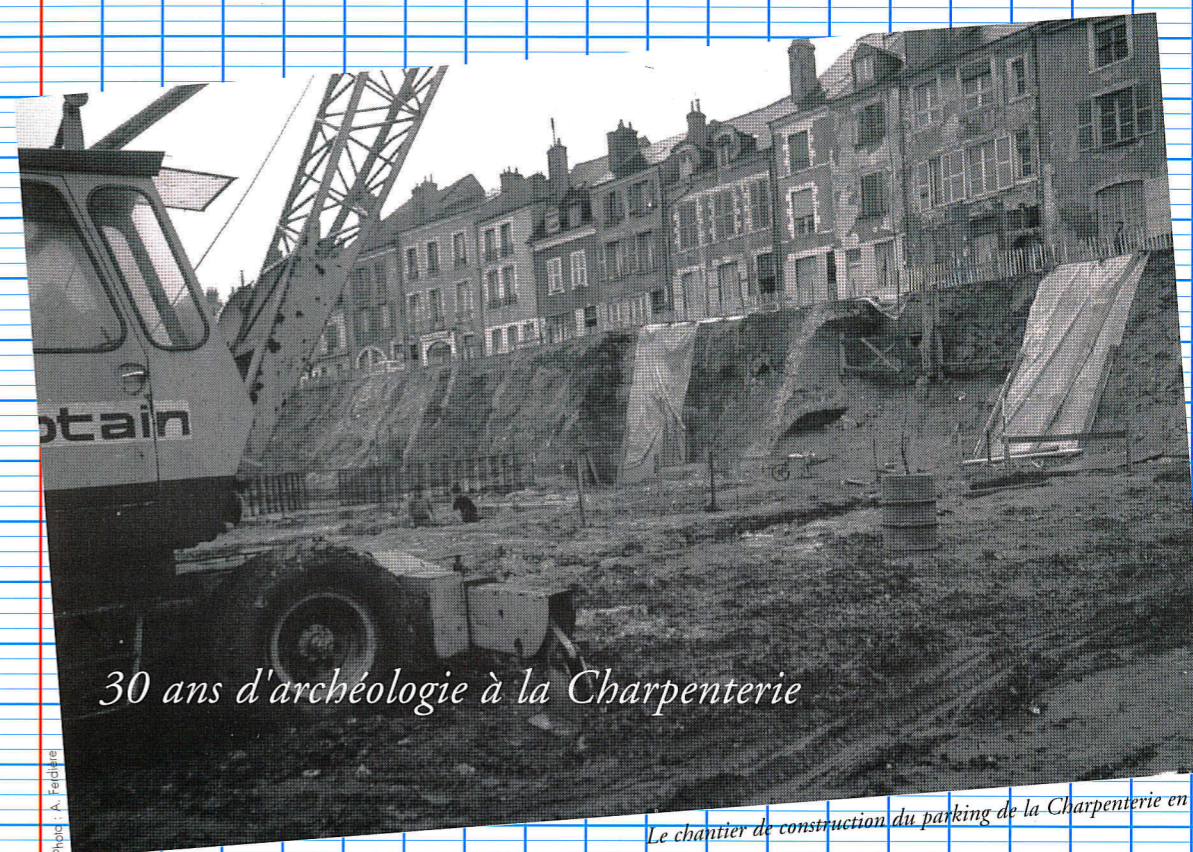
30 ans d'archéologie à la Charpenterie